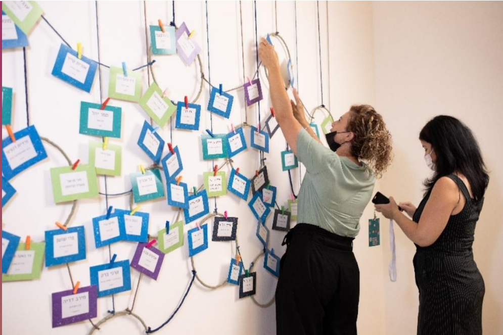
מפגש הרשת הראשון

מפגשים מקוונים להיוועצות קבוצתית סביב מגוון נושאים, מפגשי עדכונים מקוונים, שאלות און-ליין, מפגשים קצרים עם צוותי הארגונים מעבר לשיח השוטף עם נציג/ה הארגון ביוזמה, ועוד.