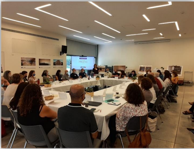
מפגש ראשון של ועדת ההיגוי, ינואר 2021

כאמור, הכנת סקירת הידע כבסיס ליוזמה תרמה רבות ליכולת של ארגון השדרה לפעול בשדה שבו לא היה לו כל ניסיון קודם. הסקירה ביססה את התפיסה של ארגון השידרה כגורם מקצועי, מומחה ביצירת שותפות מבוססת ידע ונתונים, והניחה תשתית לשפה משותפת. בהמשך, גיבוי החלקים השונים של שלב התכנון במחקר נוסף מהעולם, ובנתונים נוספים מהארץ, חיזקו את התפיסה המקצועית שהלכה והשתרשה.