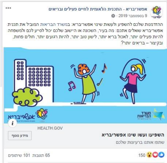
פוסט בדף של אפשריבריא עם לינק לאתר השיתוף